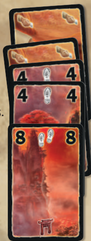
Cartes formant une expédition

Lorsque vous placez la première carte d'une couleur devant vous, elle commence l'expédition. Toutes les cartes de cette même couleur que vous jouerez ensuite devront être ajoutées à cette expédition. Lorsque vous ajoutez des cartes à une expédition, placez-les de manière légèrement décalée afin de pouvoir facilement lire leur valeur, comme illustré ci-contre.