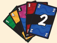
Cartes en main