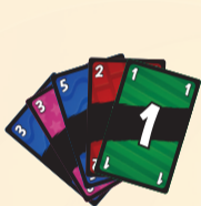
Cartes en main

Mélangez les cartes numérotées et distribuez-en 5 face cachée à chaque personne. Placez les cartes restantes face cachée au centre de la table pour former une pioche et retournez la première carte. Elle constitue le début de la défausse. (si la carte retournée est une carte Joker, mélangez à nouveau le paquet et retournez une nouvelle carte)