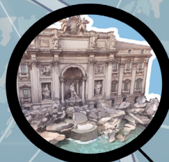
FONTAINE DE TRÉVI